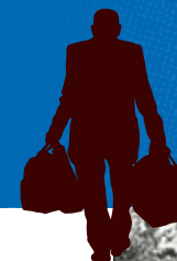
Immigrés devant le foyer Le Rhône, Huningue, années 1960.

D'autres interviews de Chibanis sont ensuite menées dans d'autres foyers ou résidences sociales de la région... L'exposition s'est construite autour de ces récits de vie.