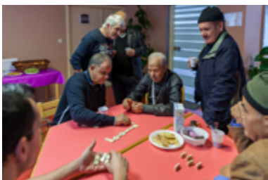
Une partie de dominos au foyer, Mulhouse, 2016.

En ces temps de confusion, de crainte exacerbée où l'on (re)met en avant les vertus des valeurs républicaines, ce projet se veut un moyen, certes modeste, d'œuvrer pour rétablir du lien et redonner sens à la notion de « vivre ensemble ».