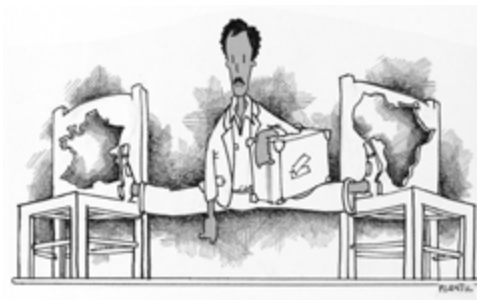
Entre deux chaises, dessin de Plantu, Le Monde , 1979. Avec l'aimable autorisation de Plantu, droits réservés

L'exposition De l'immigré au Chibani est un projet fédérateur, conçu par l'association Aléos, l'Observatoire Régional de l'Intégration et de la Ville (ORIV) et le Centre de Recherches sur les Economies, les Sociétés et les Techniques (CRESAT), en partenariat avec le Musée Historique de Mulhouse.