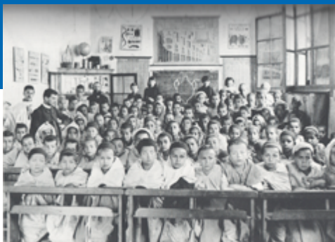
Une école en Grande Kabylie, vers 1900.