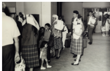
Arrivée d'immigrés à Saint-Louis, 1962.