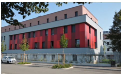
La résidence sociale La Rochelle, Mulhouse, 2014.

En Alsace, et en particulier dans le Haut-Rhin, leurs histoires individuelles se confondent dans une destinée collective qui accompagne les heures glorieuses de l'industrie. Cette exposition témoigne de leur parcours.