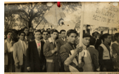
Manifestation du 1 er mai 1954, Mulhouse.